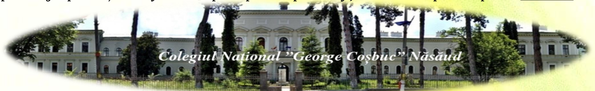
Colegiul Național „George Coșbuc” Năsăud

Rezultatul fiecărei probe se apreciază cu „ADMIS” sau „RESPINS”. Nu se admit contestații la probele de aptitudini. Respingerea la o probă atrage după sine obținerea calificativului „respins” la probele de aptitudini. Afișarea rezultatelor la probele de aptitudini 23 mai 2022 .