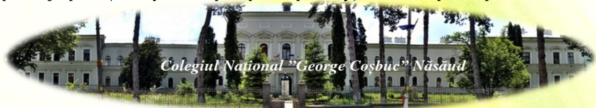
Colegiul Național „George Coșbuc” Năsăud

Rezultatul fiecărei probe se apreciază cu „ADMIS” sau „RESPINS”. Nu se admit contestații la probele de aptitudini. Respingerea la o probă atrage după sine obținerea calificativului „respins” la probele de aptitudini. Afișarea rezultatelor la probele de aptitudini 22 mai 2018 .