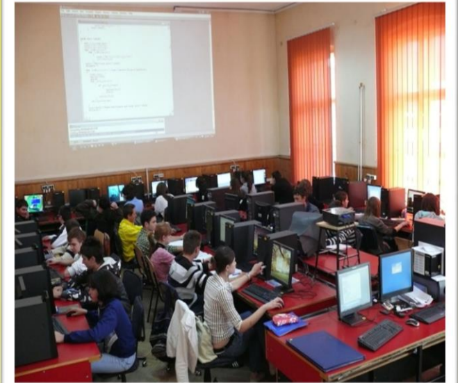
Laborator de informatică