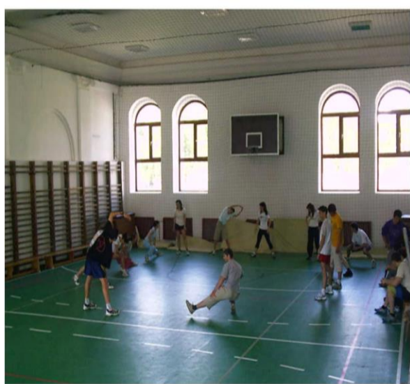
Sala de sport

Rezultatul fiecărei probe se apreciază cu „ADMIS” sau „RESPINS”. Nu se admit contestații la probele de aptitudini. Respingerea la o probă atrage după sine obținerea calificativului „respins” la probele de aptitudini. Afișarea rezultatelor la probele de aptitudini 29 mai 2017.